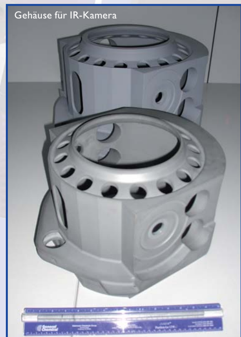
Gehäuse für IR-Kamera